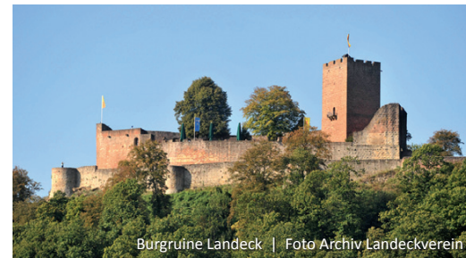
Burg Landeck

Die Burg Landeck wurde als jüngste Schutzburg des Klosters Klingenmünster vermutlich um 1180 erbaut. Als Reichsburg gehörte sie mit zum Ring der Vorburgen des Trifels.