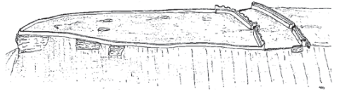
Skizze der Fliehburg auf dem Heidenschuh

Die Ruine Heidenschuh , eine frühmittelalterliche Fliehburg, wurde vermutlich im 8. oder 9. Jahrhundert in 430 bis 455 m Höhe auf der Nordostspitze des Heidenschuhs erbaut. Der Name „Heidenschuh“ ist wahrscheinlich gleichbedeutend mit „Riesenschuh“ und leitet sich von der Form des Berges ab. Kurz vor dem Aussichtspunkt des Heiden-