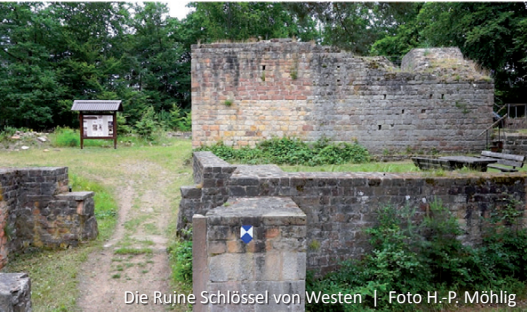
Die Ruine Schloßel von Westen

zur Ringwallanlage, die die äußere Begrenzung der Burg Schloßel darstellt. Der Weg kreuzt den äußeren Wall bei etwa 322 m Höhe. Der steinerne Wall ist hier noch deutlich zu erkennen. Wir bleiben auf dem Weg, der uns weiter zum inneren Wall und zu einer Schautafel bringt, auf der die Ringwallanlage erklärt wird. Von hier führt uns der Weg über Tor 1 hinauf auf das „Schloßköppl“ in etwa 355 m Höhe zur Ruine der Burg aus salischer