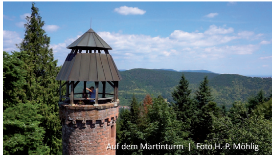
Auf dem Martinturm

503 m höchsten Punkt der Gemarkung Klingenmünster und den Martinsturm , der eine beeindruckende Rundumsicht bietet und zur Gipfelrast einlädt.