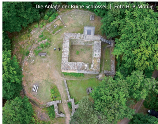
Die Anlage der Ruine Schloßel

Zeit. Der ursprüngliche Name der Burg ist nicht endgültig erforscht. Die Bezeichnung „Schloßel“ oder „Waldschloßel“ stammt von Bauern aus der Umgebung. Um 1030/1050 wurde die Kernburg als Adelsburg auf einer natürlichen Felskuppe errichtet, die als höchster Punkt Teil der viel älteren und größeren Fliehburg war, die wahrscheinlich schon im 9. Jahrhundert erbaut wurde. Wir betreten die Burganlage durch das