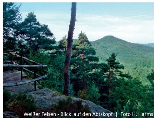
Weißer Felsen - Blick auf den Abtskopf

cher auf sein Plateau mit Blick ins idyl-lische Klingbachtal und den gegenüber liegenden Abtskopf belohnt. Von hier wandern wir auf dem Burgenweg weiter zur Landeck, der dritten Burg.