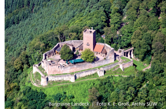
Burg Landeck

Der einzige Zugang zur Burganlage führt von Norden über eine auf Pfeilern gelagerte Holzbrücke, deren letztes Drittel früher als Zugbrücke ausgelegt war, durch das äußere Burg- oder Brückentor. Über dem Tor erhob sich früher ein rechteckiger Turm, dessen Mauerreste noch heute bis zur Scheitelhöhe des Torres reichen. Durchs Vorwerk gelangen wir zum inneren Tor in der Zwingermauer.