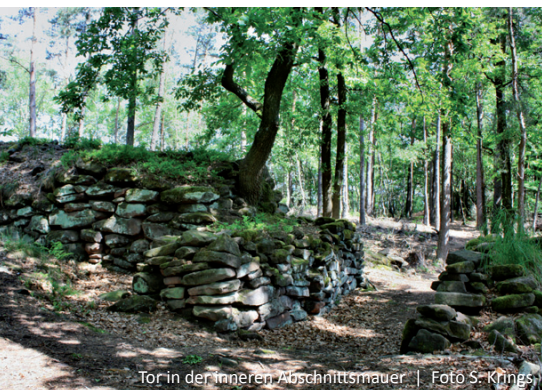
Tor in der inneren Abschnittsmauer

Der Abstieg beginnt knapp 100 m nordwestlich des Turmes, wo der Burgenweg westlich des Vorplatzes hinabführt. Der Weg wendet sich bald nach Südosten und bietet beeindruckende Ausblicke über das obere Klingbachtal und die Berge um Silz und Gossersweiler-Stein. Bevor der Weg nach Osten biegt, liegt rechter Hand der „Weiße Felsen“, der den kurzen Abste-