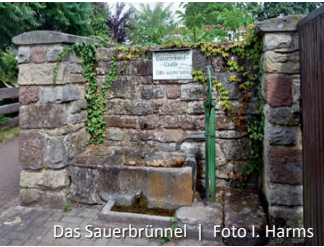
Das Sauerbrünnel

Auf der Weinstraße in nördl. Richtung biegen wir bald nach rechts über die Brücke in den Weg entlang der alten Klostermauer, der kurz darauf erneut über den Bach führt. Hinter der Brücke steht rechts das kleine „Sauerbrünnel“, dessen