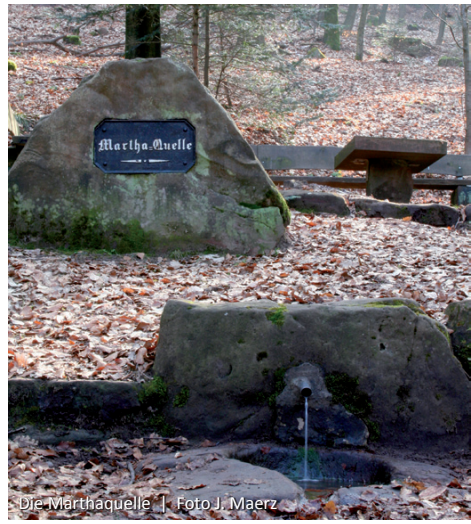
Die Marthaqueelle