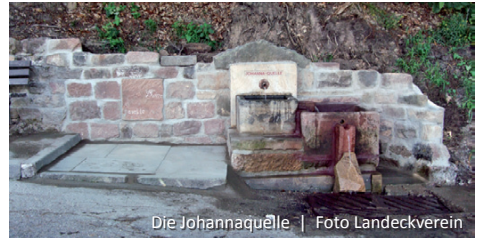
Die Johannaquelle

Name zurückgeht auf eine historische Bezeichnung für eine Quelle mit mineralhaltigem Wasser. An der Straßeneinmündung wenden wir uns nach links und wandern vorbei an Gärten und Weideland, überqueren die „Lettgasse“ und gehen durch den „Kahngarten“ zur „Weinstraße“. Unterhalb des Kreisels queren wir nach links in den „Magdalenenweg“, der nach ca. 100 m auf die „Alte Straße“ trifft. Hier biegen wir rechts ab und erreichen nach etwa 600 m die