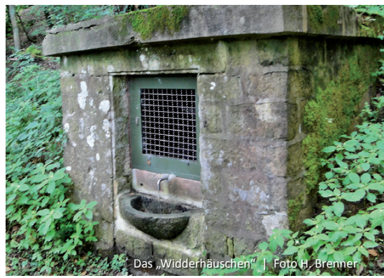
Das „Widderhäuschen“

Über „Obere Hofwiese“, „Landeckstraße“ und „Totenweg“ geht es ins Tal hinunter und weiter am Klingbach entlang zum Ausgangspunkt in der Ortsmitte.