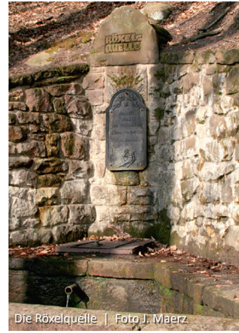
Die Röxelquelle

Die längere Variante (V1) des Quellenwegs führt weiter hinunter zur „Erb-Quelle“. Wer sich das ersparen möchte, wandert auf dem breiten Forstweg (V2), wo sich nach ca. 500 m beide Wege vereinen, unterhalb des „Weißen Felsen“ zur