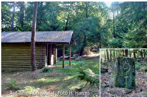
Auf dem Abtskopf

den wir einen „ Abtsstein “ als Zeugen der kurpfälzischen Grenzsicherungen. Er trägt das Zeichen der Herrschaft des ehemaligen Klosters Klingenstein, den Abtsstab. Eine Schutzhütte und eine als mächtiger Tisch aufgestellte Felsplatte laden zur Rast mit weiter Sicht ins westliche Bergland über Gossersweiler-Stein.