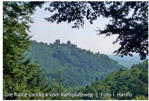
Die Ruine Landeck vom Karlsplatzweg

Die Anlage leitet einen Teil des Wassers in den künstlich angelegten Mühlbach, der das Mühlrad der Boxmühle antreibt. Nach ca. 200 m treffen wir auf den breiten Forstweg, der entlang der Nordhänge von Hatzelberg und Röhlberg bis kurz vor dem Karlsplatz kontinuierlich an Höhe gewinnt. Nach gut einem Kilometer beschreibt er eine weite Rechtskurve und biegt gleich wieder links in westliche Richtung. Hier haben wir einen schönen Blick auf die gegenüberliegende Talseite mit der Burg Landeck am Talaustrang. Ein Stück weiter oben bietet