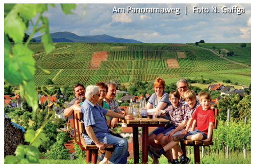
Am Panoramaweg

August Becker sollten wir uns ein paar Minuten Zeit nehmen, bevor wir durch das Rebland östlich weitergehen. Nach dem Abzweig links ins Tal, wenden wir uns stärker nördlich und überqueren die Landstraße und den Klingbach, der