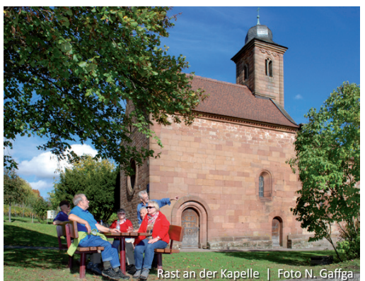
Rast an der Kapelle

biegen links ins Mühlthal ein, um nach wenigen Schritten wieder links den kurzen, steilsten Abschnitt unserer Wanderung zu bewältigen. Lichter Kastanienwald wechselt mit immer wieder beeindruckender Fernsicht über die Rheinebene ab. Auf der Landeck gönnen wir uns eine ausgiebige Rast im Biergarten der Burgschänke. Klingenmünster liegt uns nun zu Füßen. Dahinter schweift der Blick vom Odenwald im Nordosten über den Kraichgau bis in den Schwarzwald im Süden. Der Rückweg beginnt im Burggraben und führt durch schattigen Kastanienwald hinunter zum Klingbachhof, von wo uns der bekannte Weg in Richtung Ortsmitte bringt.