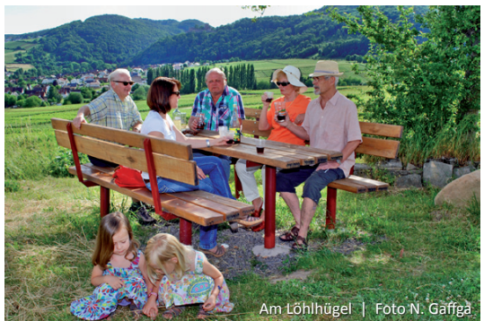
Am Löhlhügel

gesäumt von den Wiesen der Talaue, gemächlich dahinfließt. Im Westen über Klingenmünster thront die Burg Landeck. Wir gewinnen wieder an Höhe, biegen unterhalb der Kammlinie des Löhlhügels nach Nordwesten ab und sind längst wieder in die unzähligen Reben eingetaucht. Der Haardtrand rückt näher, südlich unter uns liegt Klingenmünster und aus der Ferne grüßt der Schwarzwald. Die Wein-