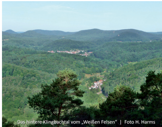
Das hintere Klingbachtal vom „Weißen Felsen“

Wer den direkten Weg nach Silz bevorzugt, wählt den Pfad (V3) der von der „Silzer Linde“ in entgegengesetzter Richtung zwischen Königsbuchen und Katzenhecke hinunterführt. Er vereint sich am westlichen Dorfeingang mit dem vom Wild- und Wanderpark kommenden Weg. Von den Haltestellen am Park und in Silz fahren Linienbusse zurück nach Klingingenmünster. Reicht die Kondition aber noch aus, empfehlen wir den Rückweg zu Fuß. Wir bleiben zunächst parallel zum Klingbach, bevor der Weg bei Münchweiler die Landstraße über eine Brücke quert. Münchweiler verlassen wir auf einem leichten und kurzen Anstieg und wandern oberhalb der Talauflage des Klingbachs östlich. Um die Höhe zu halten, zwingt uns die Röckelsaler Halde mehrmals zum Richtungswechsel, bevor wir unterhalb des „Weißen Felsen“ in östlicher Richtung zur Burg Landeck wandern. Der Abstieg nach Klingingenmünster erfolgt über den Panoramaweg ins Tal. Von dort sind es nur wenige Minuten durch die Parklandschaft am Mühlbach und vorbei am See, zurück zum Ausgangspunkt in der Ortsmitte.