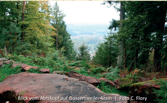
Blick vom Abtskopf auf Gossersweiler-Stein

deck über Klingenmünster. Beim Absteiger auf den 487 m hohen Abtskopf, der höchsten Erhebung unserer Wanderung, finden wir auf dem Berggipfel den Abtsstein als Zeuge der kurpfälzischen Grenzsicherungen. Er trägt das Zeichen der Herrschaft des ehemaligen Klosters Klingenmünster, den Abtsstab. Hier oben reicht die Sicht weit ins südwestliche Bergland, zu Burgen, Felsen und auf die in tiefe Täler eingebetteten