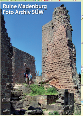
Ruine Madenburg