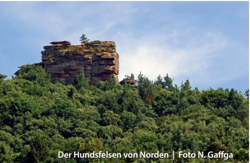
Der Hundsfelsen von Norden

Zurück auf gleichem Weg, lassen wir den von Waldhambach kommenden Abzweig links liegen und sind schnell am Fuß des Treutelskopfes. Wer den steilen Aufstieg des Hauptweges (V1+V2) nimmt und weiter über (V1) zum Martinsturm wandert, wird mit einzigartiger Aussicht belohnt. Vorbei am „ Weißer Felsen “ gehen wir weiter zur Burg Landeck . (V2) meidet den Gipfelaufstieg, während (V3) den Treutelsberg mit geringem Höhenunterschied umgeht. Von der Burg Landeck führt uns die Route der „Quellenrunde“ (Seite 12-13) zum Ausgangspunkt zurück.