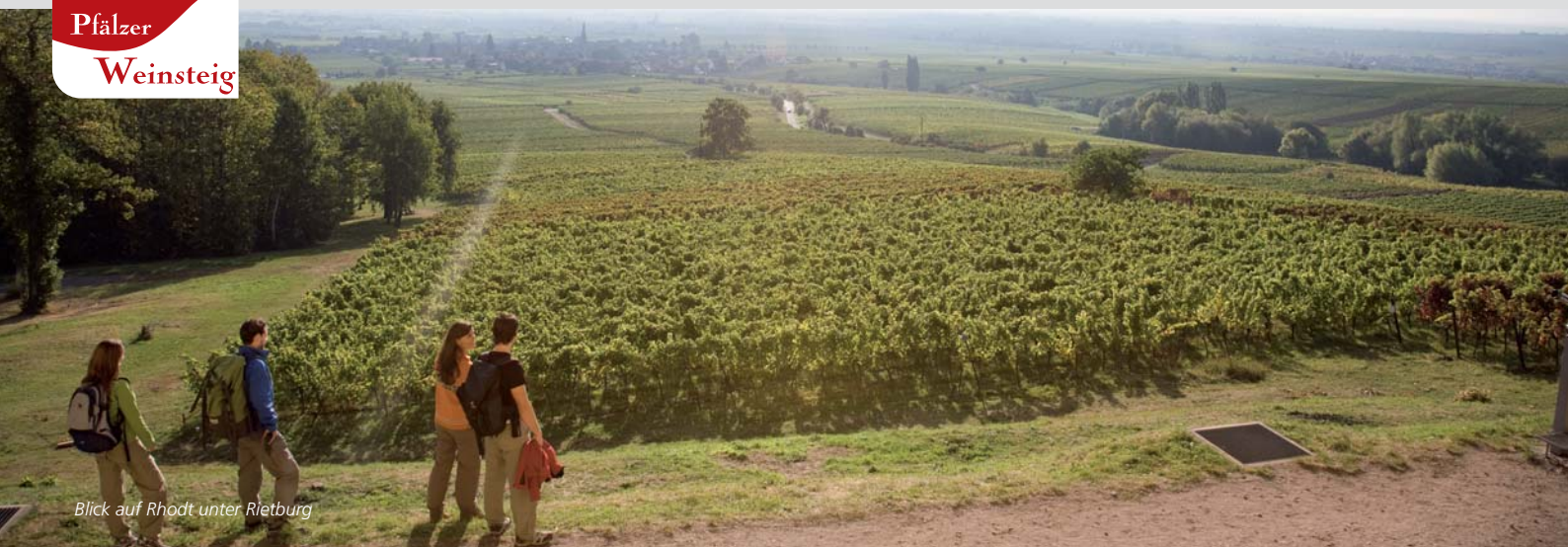
Blick auf Rhodt unter Rietburg