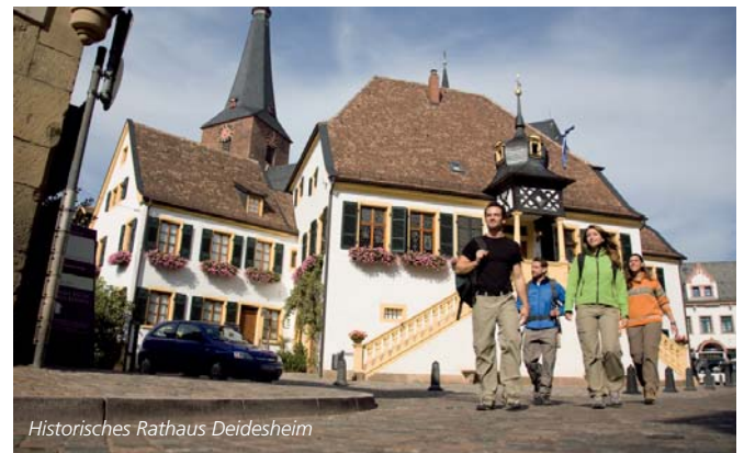
Historisches Rathaus Deidesheim

Spitzenwinzer halt und entkorkt die Flasche anschließend direkt im Weinberg – nirgends schmeckt ein Schluck Pfälzer Wein besser! Viele Burgruinen, das Hambacher Schloss, die Villa Ludwigshöhe und die 650 Meter hohe Kalmit bieten immer wieder reizvolle Aussichten über die Wingerte hinweg in die Rheinebene. Der Weinsteig endet wie der Waldpfad in Schweigen. Unermüdliche können also direkt weiter wandern.