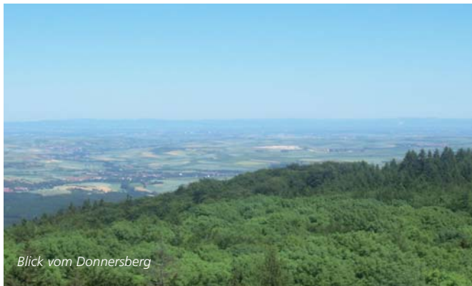
Blick vom Donnersberg

stadt und den zahlreichen Fachwerkhäusern bezaubert. Im beschaulichen Rockenhausen lässt Sie das Turmuhrenmuseum die Zeit vergessen. Zwischen den kurzen Auf- und Abstiegen bieten spektakuläre Aussichten in die Rheinebene Gelegenheiten zum Picknicken. Ob von den Burgruinen Alt- und Neuwolfstein, dem Aussichtspunkt Juche bei Meisenheim, der Ruine Moschelandsburg oder dem Königstuhl am Donnersberg, der mit 675 Metern den höchsten Punkt der Route markiert: die Ausblicke sind ebenso zahlreich wie himmlisch!