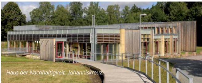
Haus der Nachhaltigkeit, Johanniskreuz

Wanderschuhe nicht mehr weiter wollen, finden Sie in der Schuhmetropole Hauenstein garantiert ein neues Paar. Das Dahmer Felsenland führt Sie an bizarren Steingebilden vorbei durch eine wildromantische Landschaft bis zur Ruine Drachenfels, mit ihren in den Fels geschlagenen Aufgängen, und der Burg Berwartstein – dem Inbegriff von Burgromantik. Der Weg endet in Schweigen am Deutschen Weintor. Besonders ist auch der Startpunkt: Vom Hauptbahnhof in Kaiserslautern geht es vom ICE direkt auf den Wanderweg. Schneller geht's nicht!